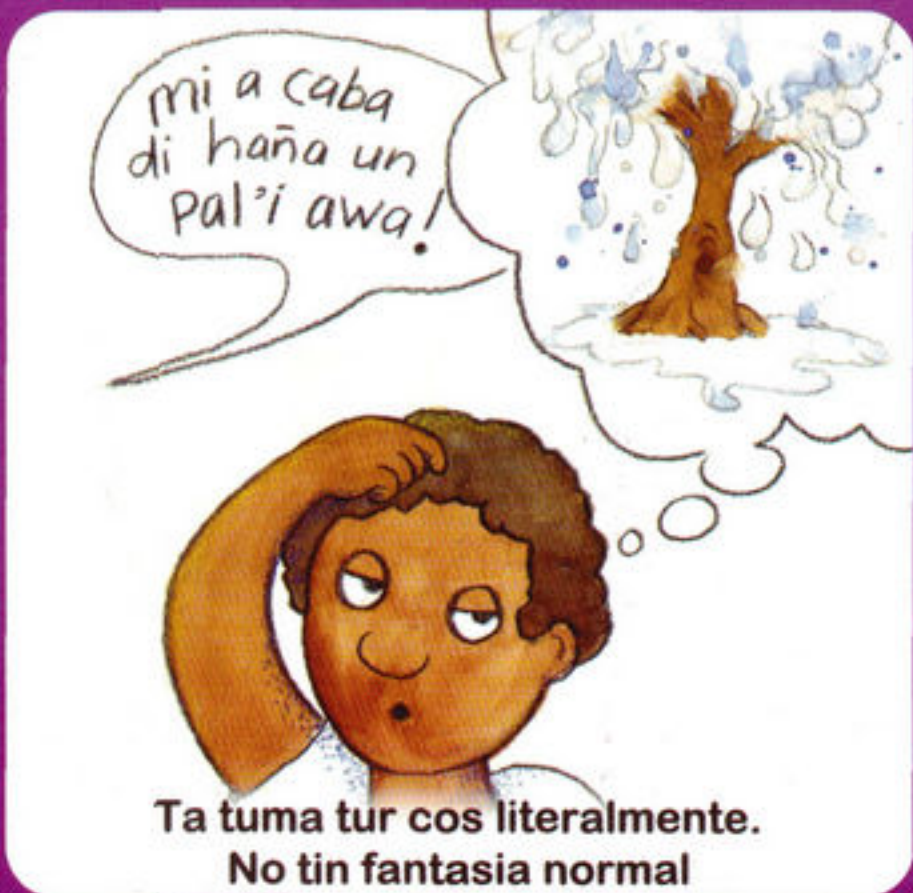
Ta tuma tur cos literalmente. No tin fantasia normal